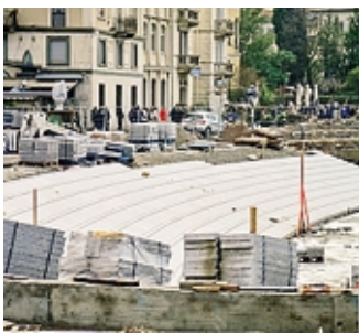
Il cantiere del lungolago

La notte appena trascorsa, potrebbe essere stata l'ultima di quello che in questi lunghi anni - il procedimento penale era stato aperto addirittura nel 2015 - abbiamo imparato a conoscere come il processo alle paratie antiesondazione del lago di Como. Una vicenda per cui la Procura aveva chiesto 40 anni di carcere complessivi per i vari imputati, ma che ieri - di