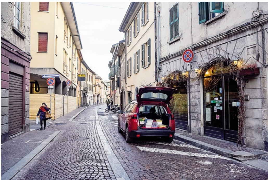
Via Borgovico vecchia potrebbe entrare a far parte delle aree a traffico limitato